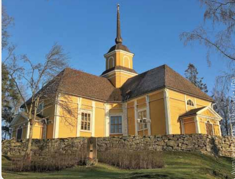
Nurmijärven kirkko, kirkonkylä • LiTap