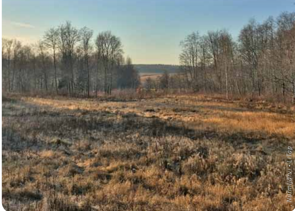
Nurmijärvi • Liitap

Tilinumero FI48 8000 1501 4822 03 viite 21526