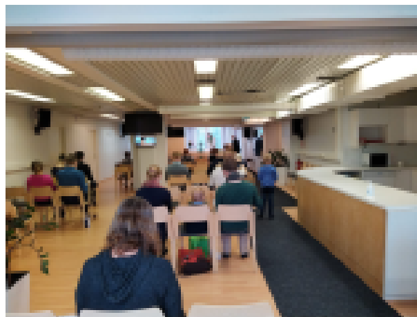
Nuorekas elämä on jälleen vallannut Alppikodin kirkkosalin.

Merkittävä osa toiveista on tehty erityisesti nuoremman väestön mukaan saamiseksi. Uusi messu onkin tässä suhteessa lähtenyt liikkeelle mukavasti. Esim. ensimmäisellä kerralla n. kolmannes osallistujista oli alle 30-vuotiaita. Lapsien määrä on jälleen mukavasti kasvusuunnassa. On kuitenkin sanottava, että samalla kun iloitsimme siitä, että nuorempi väki on löytämässä messumme, emme tahdo menettää ketään.