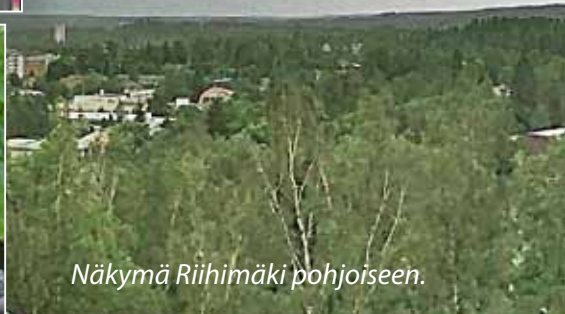
Näkymä Riihimäki pohjoiseen.